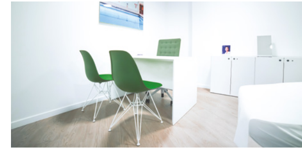
Claris Bruxelles (Quartier Européen)