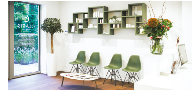
Claris Liège (Château des Thermes)

Située au cœur de la Forêt de Soignes, sur le domaine privilégié de l'hôtel Dolce, Claris Clinic La Hulpe est un véritable havre de paix en périphérie de Bruxelles. Plongez dans un cadre verdoyant où le design contemporain de la clinique allie harmonieusement esthétique, fonctionnalité et confort. Offrez-vous une expérience unique dans un lieu où chaque détail est pensé pour votre bien-être.