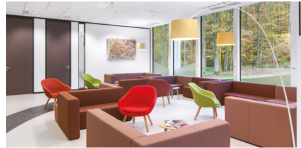
Claris La Hulpe (Site Hôtel Dolce)

Claris Clinic vous accueille dans ses centres de La Hulpe, Liège (Chaudfontaine) et en plein cœur de Bruxelles, dans le quartier européen. Notre mission est de vous offrir des soins personnalisés et complémentaires dans chacun de nos établissements, en veillant à votre satisfaction et à votre bien-être.